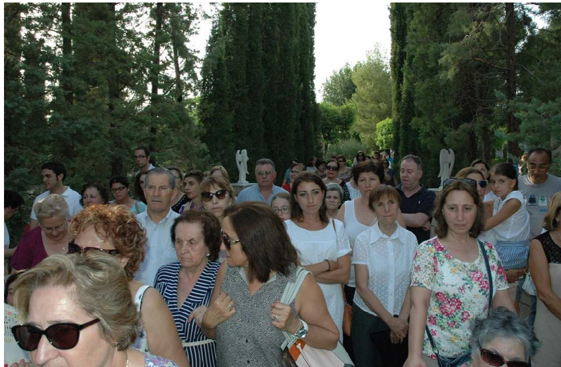
Participación masiva de fieles