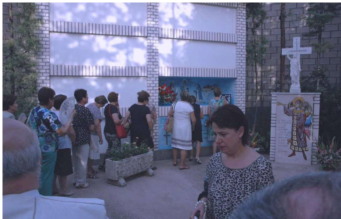
Fieles acercándose a la sepultura de la Sierva de Dios y encomendándose a ella